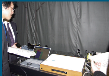
2010年の実習風景：回折格子を用いた手作り分光器（上）と干渉実験（下）。